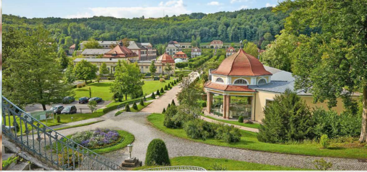
Bad Brückenau Schlosspark Staatsbad