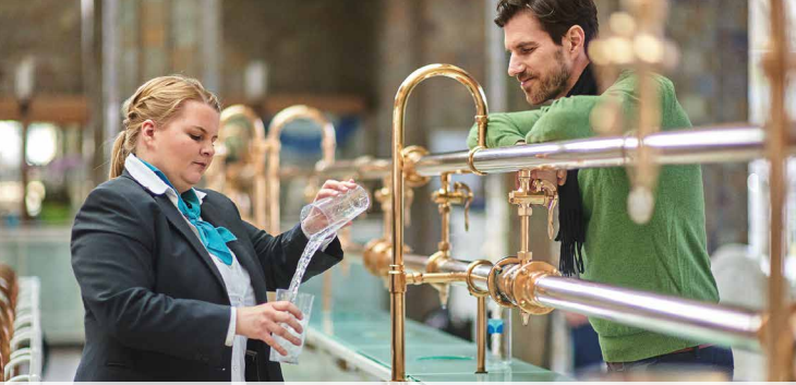
Bad Kissingen Brunnenhalle